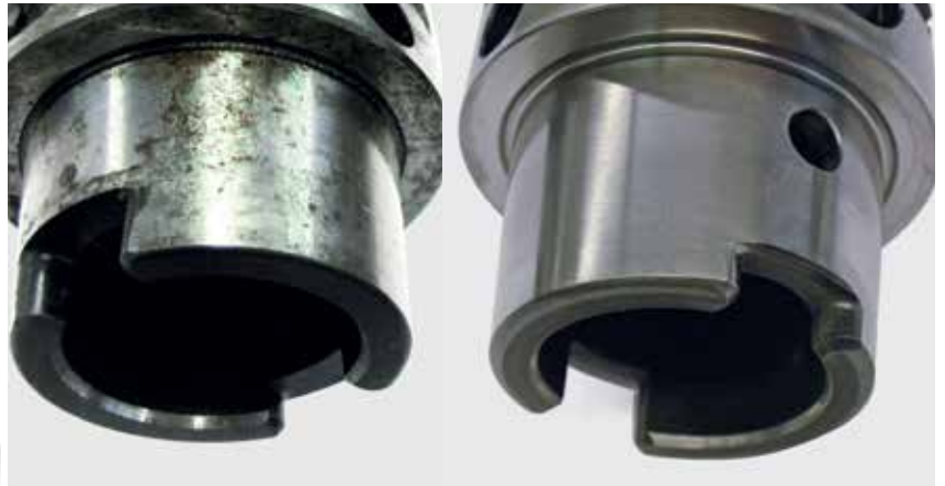
Prima della pulizia